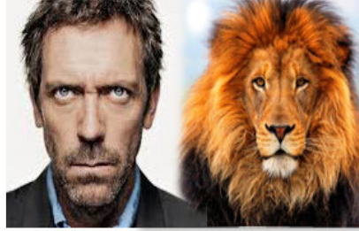
முன்னோக்கிய கண்களுடன் அசைவ விலங்கினங்கள்

என்பதை அறிந்துக்கொள்ள முடிகிறது. ஆனால் இந்தக் கண்களைத்தவிர மற்ற மனித கூறுகளெல்லாம் படிபடியாக சைவ உணவிற்கு ஏற்றவாறு மாறிவிட்டது. உதாரணமாக நமக்கு பின்புறம் இருந்த வால் மறைந்துவிட்டது. கூறிய பற்கள் மறைந்துவிட்டன, நீண்ட கை, கால் விரல்கள், மிருக பலத்துடன் கூடிய உடம்பு... இவைகளை கூறலாம். இதற்கு காரணம் நாம் தற்போது காட்டில் வாழவில்லை, ஆனால் சில மிருகங்கள் மட்டும் மனித நாட்டில் வாழ்கின்றன.