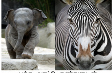
பக்க வாட்டு கண்களுடன் சைவ விலங்கினங்கள்

மாமிச உண்ணிகளுக்கு கண் நேரே பார்த்தபடி தான் இருக்கும். தாவர உண்ணிகள் மாமிச உண்ணிகளிடமிருந்து இருந்து தம்மை பாதுகாத்துக்கொள்ள சுற்றி இருக்கும் கண் உதவுகிறது. ஆனால் மாமிச உண்ணிகளுக்கு அவற்றின் இலக்கு தான் குறி. அதனாலேயே அவற்றின் கண்கள் முன்னோக்கி இருக்கிறது.